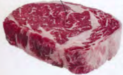
GREATER OMAHA GOLD LABEL RIBEYE STEAK

Aus der Steak-Nation No.1, den USA, genauer gesagt, von den unendlichen Weiden Ne-