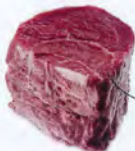
JOHN STONE DRY AGED FILET STEAK

Steakkultur. In den fruchtbaren Weiden der Pampa Humeda züchtet der Schweizer Popstar Dieter Meier auf seiner Farm diese Hereford- und Angus-Rinder. Und aus Irland stammt das JOHN STONE DRY AGED FILET STEAK.