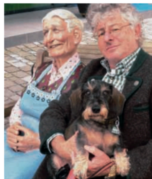
Nein, das sind nicht die Grammels – nur der Autor und sein Dackel sind echt!